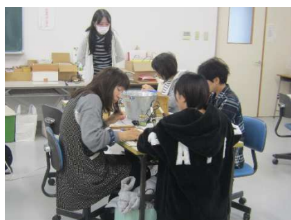
講習会開始 (生徒が制作補助)