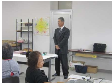
白田公民館館長 挨拶