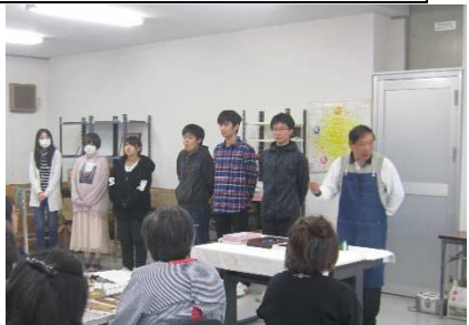
デザインクラブ自己紹介