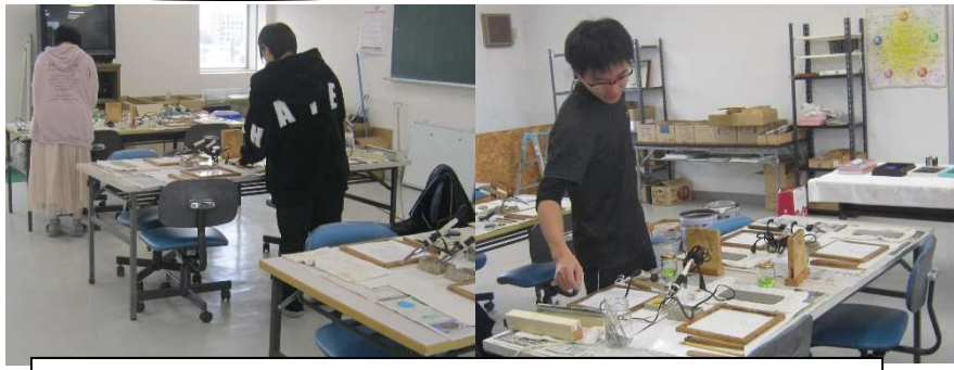
本校ステンドグラス工房会場 生徒が講習会準備中