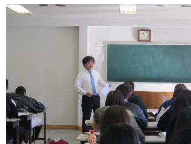
進路決定についての講演

12月16日(月): 総合的な探求の時間(2時限目～3時限目)に、週1日型2年生対象の学校別進路ガイダンスを「(株)さんぽう」さんに実施していただきました。