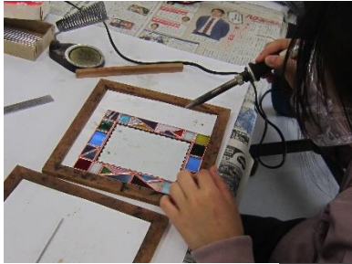
ハンダで縁取り中