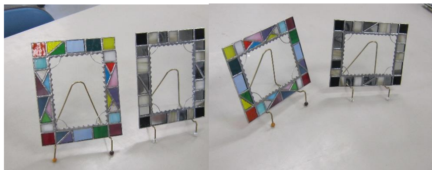
制作したフォトフレーム

新入部員（1年生）が、ステンドグラスでフォトフレーム制作をしました。ペンダント制作より難しい工程が多かったが完成した作品を見て喜んでいました。