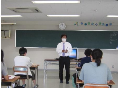
面接のポイントの講義