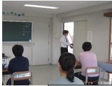
入退室のポイント講義