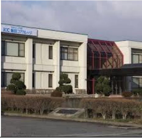
学校法人コア学園 飯田コアカレッジ